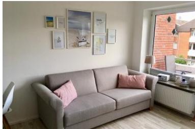
Die ausziehbare Schlafcouch.