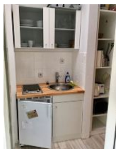
Die kleine Küche ist gut ausgestattet.