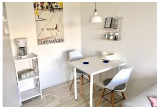
Ihr heller und freundlicher Essbereich.