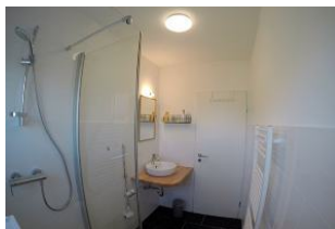
Das großzügige Badezimmer ...