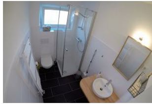
... mit Tageslicht.