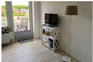
Die gemütliche Fernsehecke mit direktem Ausgang auf den Balkon.

Die im Frühjahr 2017 renovierte Einzimmerwohnung (27qm) lädt mit ihrem Frühstücksbalkon in einer ruhigen Wohngegend zum Verweilen ein. Der Wohn- und Schlafbereich verfügt über eine Sitzecke und Sofa, welches sich mit einem Handgriff in ein bequemes Bett (160x200) verwandeln lässt. Der Küchenbereich befindet sich im Flur mit Oberlicht. Das moderne Tageslichtbad ist u. a. mit Handtuchheizung und fester Duschkabine aus Acrylglas ausgestattet.